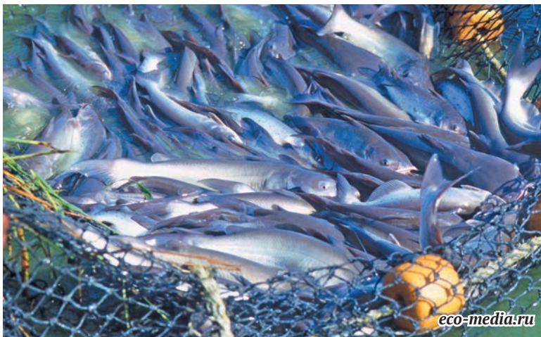
В 2014 году вступил в силу Федеральный закон «Об аквакультуре...», разработаны различные меры государственной поддержки, а именно субсидирование краткосрочных и инвестиционных кредитов в этой сфере.