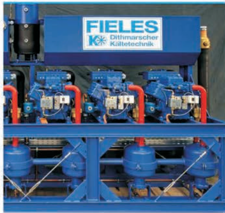
Поддержка пользователей, короткие сроки поставки

Широкий модельный ряд, индивидуальный подбор оборудования.