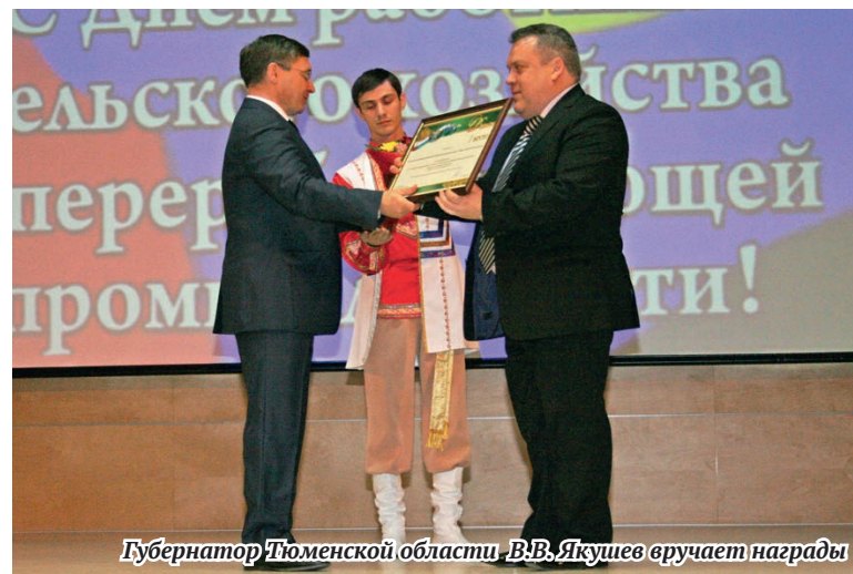
Губернатор Тюменской области В.В. Якушев вручает награды