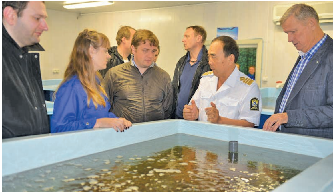
Госпрограмма развития рыбохозяйственного комплекса – одна из немногих, которая в рамках сложного бюджетного процесса получила дополнительное финансирование – более 30% прироста к 2014-му году.

«Для поддержания отрасли необходимо не только государственное финансирование, но и активная поддержка научного сообщества. Ни одним законом невозможно решить проблемы, если нет систе-