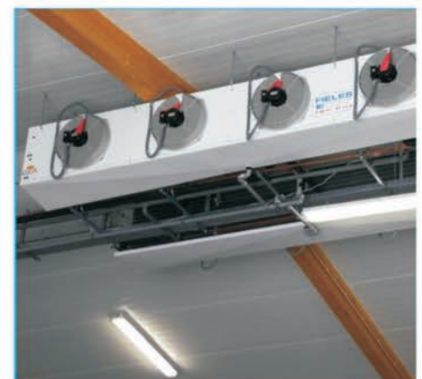
Профессиональный подход от проекта до запуска